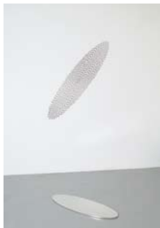
↑ Elefthérios AMILITOS

↓ Alain LAMBILLIOTTE, projet d'exposition pour le 19, 2009