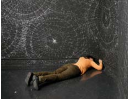
↑ Marie LEPETIT, Scrivo in vento , dessin mural, Amiens, 2008

Il font usage de procédures mathématiques et géométriques se servant de pratiques combinatoires, de jeux de répétition, que l'on peut retrouver dans les productions d'objets décoratifs en deux ou en trois dimensions telles que l'abstraction et que les avant-garde abstraites ont pu susciter dans les arts décoratifs. Mais ils les soumettent à des transformations visuelles par leur confrontation avec la lumière, la texture et les multiples possibilités cinétique et optique des matériaux et de la couleur.